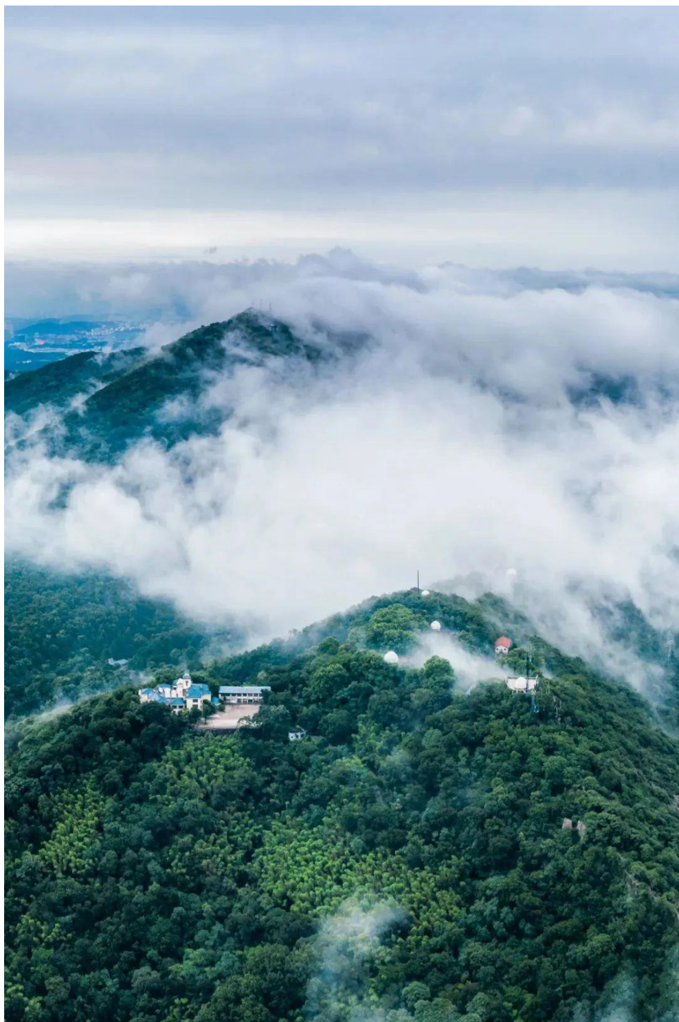
◎ 云雾之中的紫金山

南京人的口头禅就叫“多大事啊”。这就是六朝人的心态，也是六朝给予南京人的一种特别启示。在这种心态里面，南京人真的很洒脱。南京人非常喜欢《儒林外史》里的一个场景，说两个劳动人民一天劳动结束了，不是去抽大烟，而是到雨花台去看看落照，到永宁泉去吃一壶水，这最符合广东功夫茶的说法。茶的香味不是闻的，是吃下去的。所以书中的主角杜慎卿就感慨，金陵城里面的菜佣酒保都有一股六朝烟水之气。