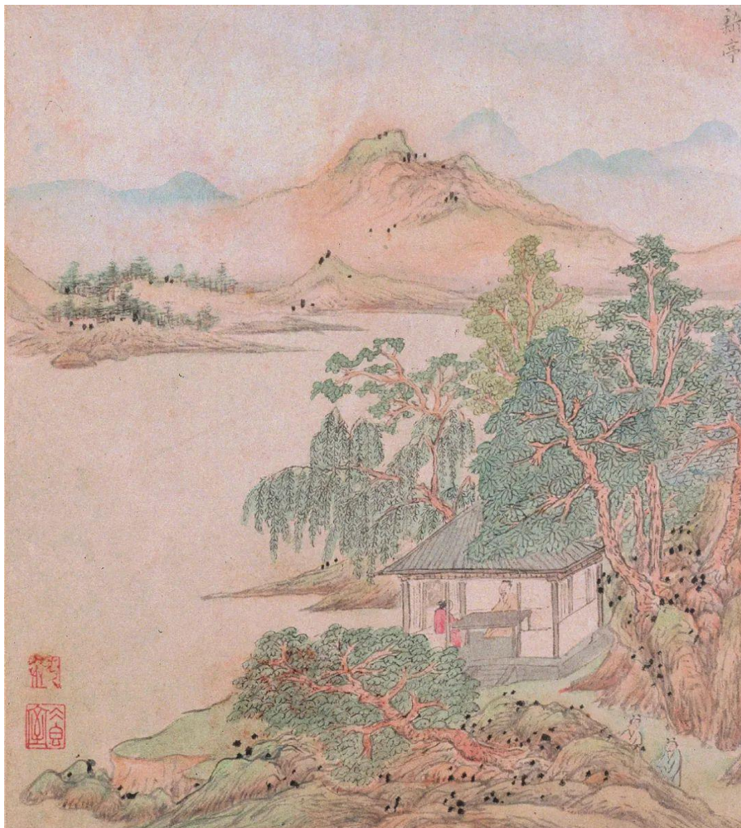
◎ 明朝文伯仁《金陵十八景图》中的“新亭”

南京这些年文旅的发展不错。比方说这些年我花了不少精力和心血的金陵小城，从根本上来说，它是一个现代新造的文旅小镇，这样的文旅小镇在中国建了很多，有的很失败。而这个金陵小城，最早设计单位灵山文旅是延续他们的一个成功项目——拈花湾，但是我作为这个项目的文化顾问，我说不可以，拈花湾很成功，但是拈花湾原来是一块空地，等于是 在一张白纸上画画，创作约束比较小。而南京金陵小城这块地方，背后的山是牛首山，山上供奉着佛祖释迦牟尼的顶骨舍利，这不是一块没文化的地方，设计单位说我们做佛教，我说做六朝。南京是六朝古都，但是由于历史的原因，除了看六朝博物馆以外，六朝古都里面看不到六朝的建筑。我觉得六朝博物馆和金陵小城可以相互映衬，到六朝博物馆，看六朝文化，寻六朝历史，到金陵小城，过六朝日子，品六朝味道，而且和后面的牛首山呼应，上山修心，下山养性。这个项目投资很大，从后来的运作来看，按照这个方向走，确实很成功。