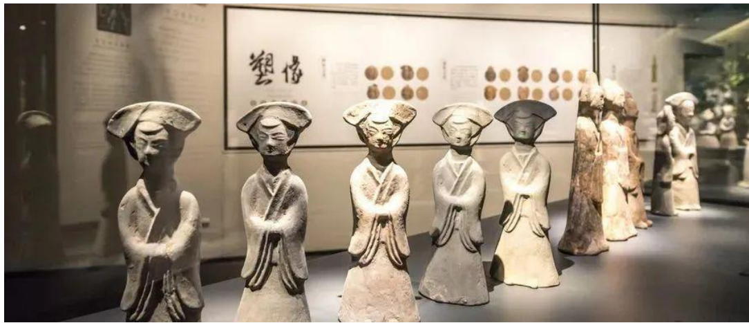
◎ 南京六朝博物馆陶俑

活平和的微笑。因为六朝是个乱世，现在人们到这样的文旅景区是放松心情的。这样的文旅景区，算不算为南京这座六朝古都赋彩，注入了灵魂呢？