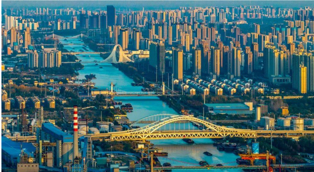
◎ 如今淮安运河上密集的船只

明代以后主要就是江南了。江淮地区因为受到环境破坏的影响而衰落了。江南这样的财富之地，这样的天堂，它开启于什么时代？开启于六朝。